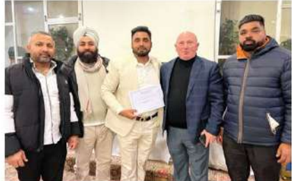
ਖੁਸ਼ੀ ਸਾਂਝੀ ਕਰਦੇ ਹੋਏ ਸਥਾਨਕ ਆਗੂ ਅਤੇ ਹੋਰ

ਵੇਨਿਸ (ਇਟਲੀ) (ਹਰਦੀਪ ਸਿੰਘ ਰੰਗ)। ਇਟਲੀ 'ਚ ਟੂਰਜਿਮ ਨੂੰ ਵਧਾਉਣ ਅਤੇ ਕਾਰੋਬਾਰੀ ਅਦਾਰਿਆਂ ਦੀ ਚਿੱਤਰਤੀ ਲਈ ਕਾਰਜਸ਼ੀਲੀ ਅਤੇ ਸੀਐਸ ਐਸ 'ਚ ਫਿਨੈਸਿਅਲ ਫੈਲੋ ਖਿੱਚੇ ਦੇ ਸ਼ਹਿਰ ਆਸਾਨੀ ਵਿਖੇ ਕਰਵਾਏ ਇਕ ਸਨਮਾਨ ਸਮਾਗਮ ਦੌਰਾਨ ਵੱਖ ਵੱਖ ਖਿੱਤਿਆ ਵਿਚ ਯੋਗਦਾਨ ਪਾਉਣ ਵਾਲੀਆਂ ਕਈ ਨਾਰੀ ਸ਼ਖਸ਼ੀਅਤਾਂ ਨੂੰ ਪ੍ਰਮਾਣ ਪੱਤਰ ਦੇਕੇ ਸਨਮਾਨਿਤ ਕੀਤਾ ਗਿਆ। ਇਸ ਦੌਰਾਨ ਪਹੁੰਚੇ ਹੋਏ ਨੁੰਮਾਇੰਦਿਆਂ ਨੇ ਐਸਸੀਏਸ਼ਨ ਦੁਆਰਾ ਵਿਸ਼ਵ ਪੱਧਰ 'ਤੇ ਕੀਤੇ ਜਾ ਰਹੇ ਕਾਰਜਾਂ ਸਬੰਧੀ ਜਾਣਕਾਰੀ ਸਾਂਝੀ ਕਰਦਿਆਂ ਦੱਸਿਆ ਕਿ ਟੂਰਜਿਮ ਅਤੇ ਵਿਦੇਸ਼ਾਂ ਵਿੱਚ ਕਾਰੋਬਾਰ ਨੂੰ ਹਰ ਵਧਾਉਣਾ ਤਰੀਕੇ ਉੱਤਸ਼ਾਹਿਤ ਕਰਨ ਲਈ ਏਸ਼ੀਆਈ ਦੇਸ਼ਾਂ ਵਿੱਚ ਵੱਡੇ ਪੱਧਰ ਤੇ ਸਹਿਯੋਗ ਮਿਲ ਰਿਹਾ ਹੈ ਤੇ ਯੂਜ਼ੇ ਦੇਸ਼ਾਂ ਤੋਂ ਇਟਲੀ ਆ ਕਿ ਵੱਜੇ ਸ਼ੁਰੂ ਸਾਰੇ ਵੱਡੇ ਕਾਰੋਬਾਰੀ ਆਦਾਰੇ ਫਿਨੈਸਿਅਲ ਫੈਲੋ, ਰਲਕੇ ਚੰਗਾ ਕੰਮ ਕਰ ਰਹੇ ਹਨ। ਇਸ ਮੌਕੇ ਉਨ੍ਹਾਂ ਵੱਲੋਂ ਵੱਖ ਵੱਖ ਖਿੱਤਿਆ ਨਾਲ ਸਬੰਧਤ